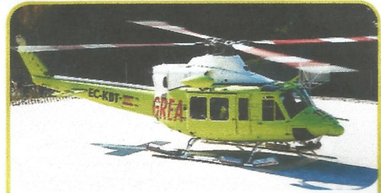
el + helicòpter