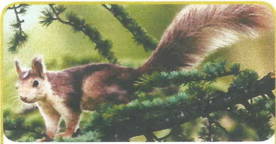
el + esquirol

Apostrofa les paraules i completa les oracions.