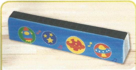
la + harmònica