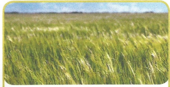
la + herba